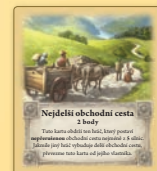
Nejdelší obchodní cesta